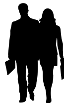
Чоловіки 20-60 років (жінки до 50 років)

Категорії осіб, які підлягають призову під час мобілізації можуть визначатися указом Президента України